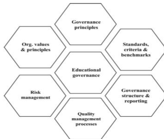
شکل ۲. ارتباط بین عناصر حاکمیت آموزشی

حاکمیت یک هنر است که شامل ظرفیت مقابله موثر با رقابت پیچیده منافع و برنامه‌ها، طیف گسترده مشارکت کنندگان، بازیگران و مناسباتی که باعث پیرفت یا شکست مجموعه می شود. حاکمیت موثر باید به محدودیت‌های زمانی، اشخاص، اهمیت مشارکت و بروکراسی در فرایند تصمیم